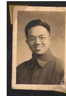
年輕黃堯，相貌與牛鼻子相像。

牛鼻子《賜福集》封面(復刻版)· 官員手拉「天官賜福」整條幅· 封底則寫著「無福可賜」· 透過漫畫針砭時弊。