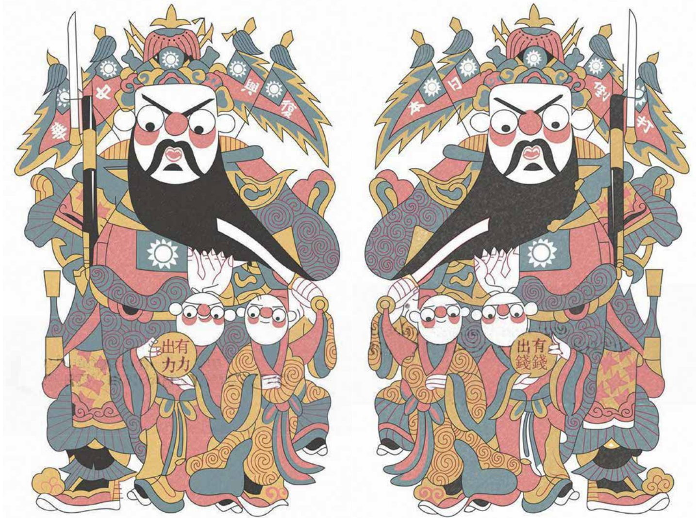
牛鼻子形像的抗日門神(復刻版)，寫著「打倒日本，復興中華，有錢出錢，有力出力」，發給居民貼在門上，宣傳抗日。